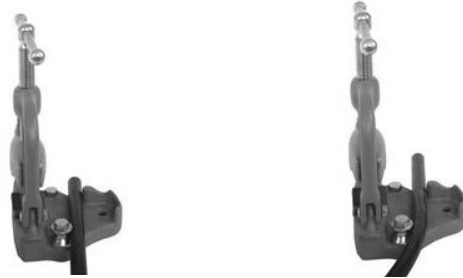
B) Верстачные тиски с хомутной защелкой