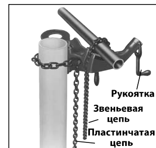
D. Переносные цепные тиски