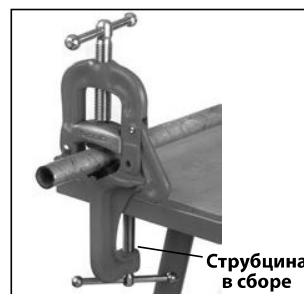
C. Переносные тиски с хомутной защелкой