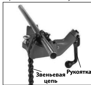
A. Верстачные цепные тиски

См. технические характеристики на этикетке изделия или обратитесь к каталогу RIDGID.