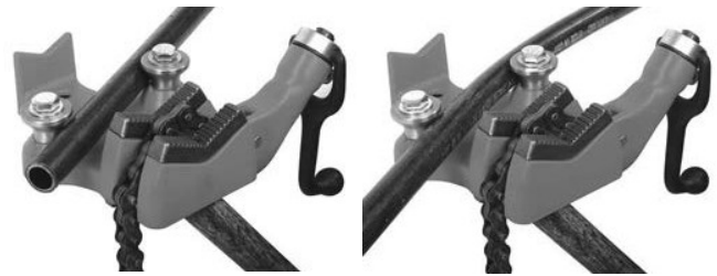
A) Верстачные цепные тиски

Для гибки расположите трубу, как показано на рисунке. Убедитесь, что конец трубы находится на достаточном расстоянии от точек опоры во избежание проскальзывания и повреждения трубы. Чтобы согнуть трубу, постепенно прикладывайте усилие к трубе.