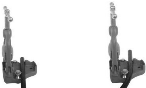
B) Stona stega sa jarmom