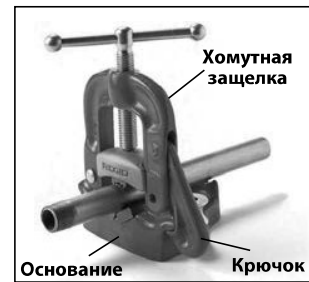
B. Верстачные тиски с хомутной защелкой