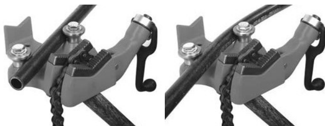
A) Stona stega sa lancem